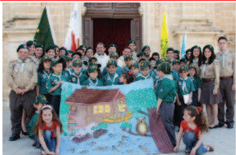
Ix-Xagħra Scout Group barra l-bieb tal-Knisja Bażilika, hekk kif spiċċat il-quddiesa