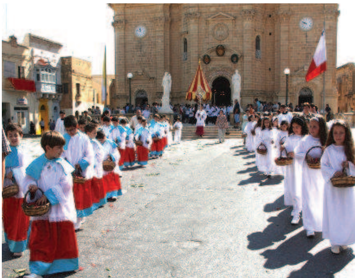
Jidhru whud mit-tmienja u erbghin tifel u tifla, mill-parroċċa tax-Xagħra li rċievew l-Ewwel Tqarbina u li ħadu wkoll sehem fil-purċissjoni.

Bullara, Spiera u lura l-Pjazza għall-Knisja Arċipretali. Tmienja u erbghin tifel u tifla, mill-parroċċa tax-Xagħra li rċievew l-Ewwel Tqarbina ħadu wkoll sehem fil-purċissjoni.