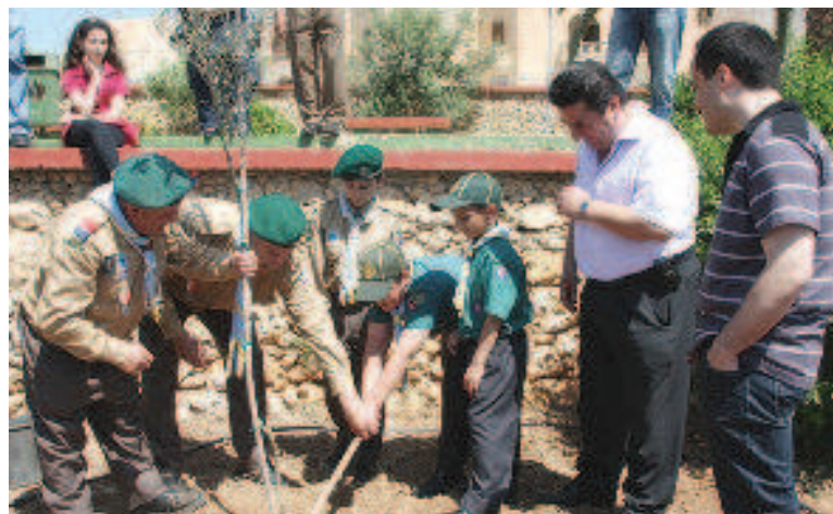
It-tħawwil tas-sigra bħala tifkira dejjiema